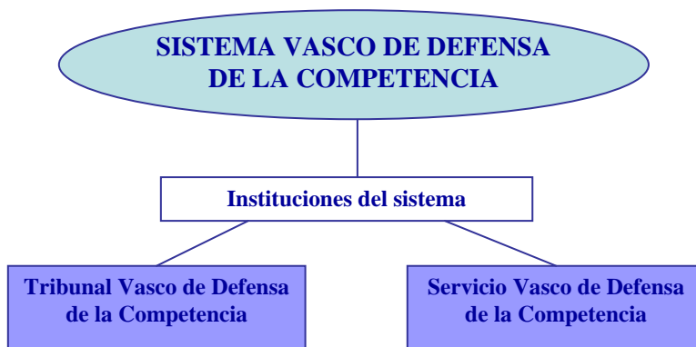
Sistema Vasco de Defensa de la Competencia

El Decreto 81/2005 depositó en dos organismos la función de defensa de la competencia en Euskadi: el Servicio de Defensa de la Competencia (SVDC) , entre cuyas funciones se encuentran la función de investigación, la función de instrucción y la función de seguimiento y vigilancia de los expedientes, y el Tribunal Vasco de Defensa de la Competencia (TVDC) , que desarrolla funciones resolutorias en los casos de conductas prohibidas, así como funciones consultivas, de tutela, de arbitraje y de promoción de la política de defensa de la competencia. El SVDC es el motor del sistema y al igual que el TVDC, ambos, son piezas imprescindibles para que el mismo funcione y se desarrolle.